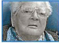
AREZZO Villa Fiorita Oggi dalle 15