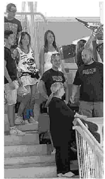
Tifosi delle V nere al palasport